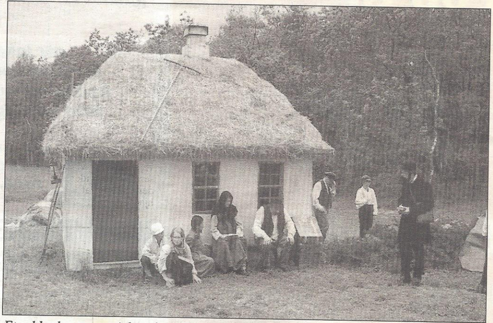
Et rakkerhus er specielt opført til friluftsspillet i Rønbjerg Mose. Her har rakkerfamilien fået besøg af mormonpræsten.

De to dannede i 1899 interessentskabet »Rønbjerg Tør-